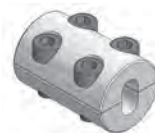
Aprieta cable Monobloc