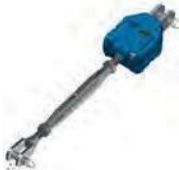
Tensor + Preajustador