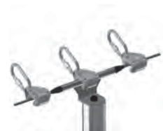
Paso a distancia de los postes intermedios con carro y pieza intermedia adaptada