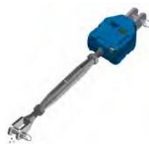
Tensor + Preajustador