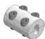
Aprieta cable Monobloc