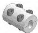
Aprieta cable Monobloc