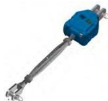
Tenditore + pre-regolatore