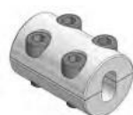
Puntale per crimpatura manuale