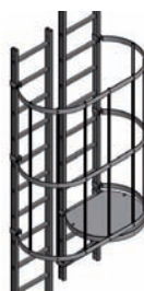
Palier de changement de volée