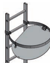
Opercule de condamnation